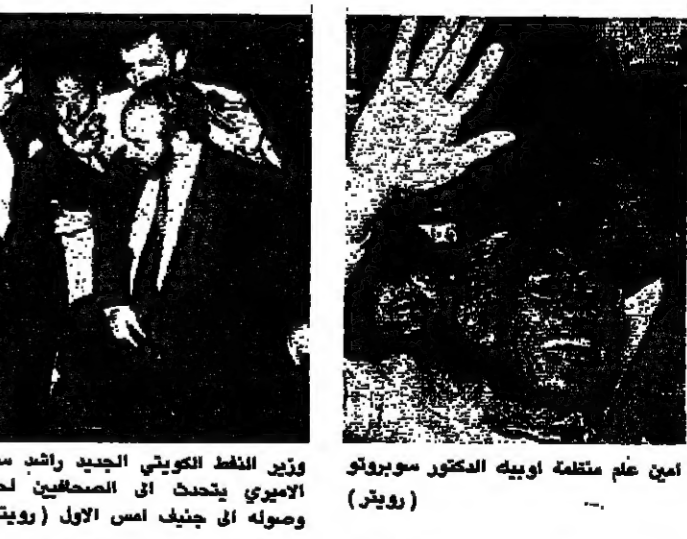
امين عام منظمة اوبك الدكتور سوروكو

اعلن الشيخ عبدالله بن خليفة آل ثاني وزير الداخلية القطري امس انه سيقتل بنجاح مؤتمر منظمة البلدان المصدرة للبترول «اوبك» الذي يبدأ أعماله في جنيف يوم ٢٦ الشهر الحالي. وقالت وكالة الانباء القطرية ان الشيخ عبدالله كان يتحدث في تصريح صحفي قبل مغادرته الدوحة على رأس وفد بلاده الى المؤتمر. ونسبت الوكالة الى الوزير قوله انه سيتم في المؤتمر تدارس الأوضاع الاقتصادية والسياسية ومناقشة المسألة الحيوية المتعلقة بالخلافات على هيل الاسعار.